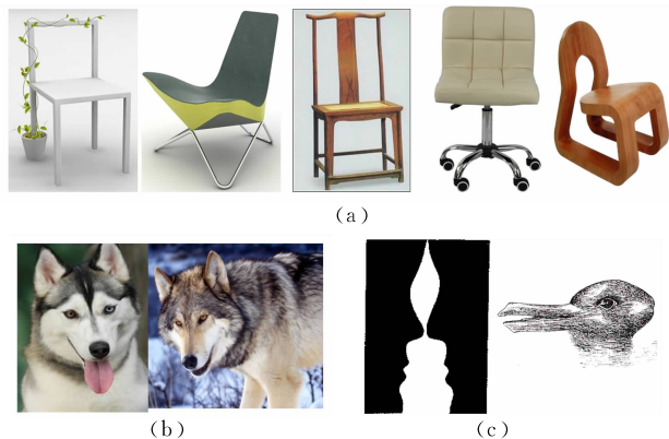
图 3 分类与检测存在挑战的例子

(3) 语义层次. 困难和挑战与图像的视觉语义相关,这个层次的困难往往非常难处理,特别是对现在的计算机视觉理论水平而言,一个典型的问题称为多重稳定性.如图 3 所示,图 3(c)左边既可以看