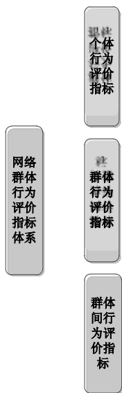
图 1 网络群体行为评价指标

为了能够定量分析网络群体行为，有必要建立可量化的评价指标体系。现有的工作主要集中在使用过程模型对网络用户信息行为进行定性描述，以及对个体行为的研究。文献[4]中对网络中用户个体行为的可信性进行研究，提出了统一度量的框架。而网络群体定量分析的研究还处在起步阶段，网络群体行为的量化评估并没有系统的规划，也没有完整的指标体系。