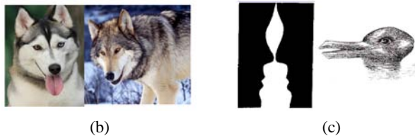
图 3 分类与检测存在挑战的例子